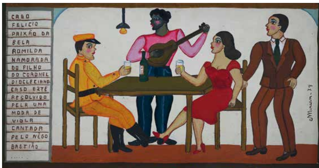
MIRIAM INES DA SILVA, V gostilni, 1979, 21.5 cm x 40 cm, olje na lesu, inv. št. GT403