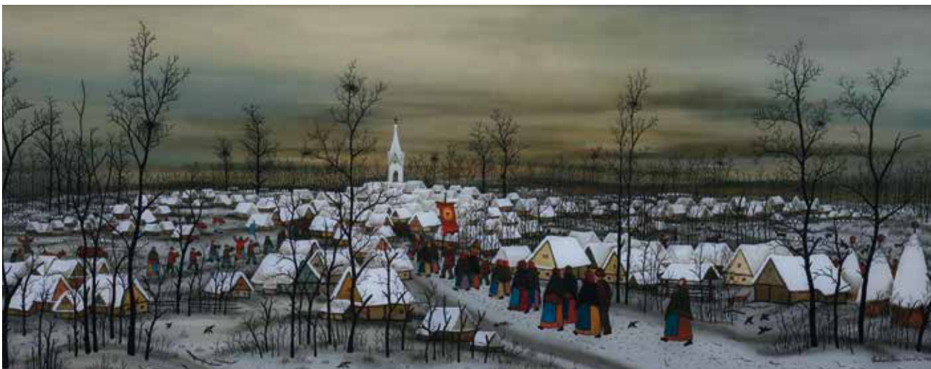
IVAN LACKOVIĆ, Dva svetova, 1969, 40 cm x 100 cm, olje na steklu, inv. št. GT26