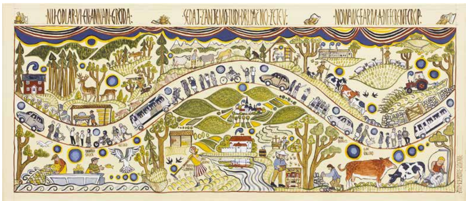
SUE PRINCE, Sedaj žanjemo tudi drugačno žetev, 2009, 46 cm x 106.5 cm, jajčna tempera na platnu, inv. št. GT1016