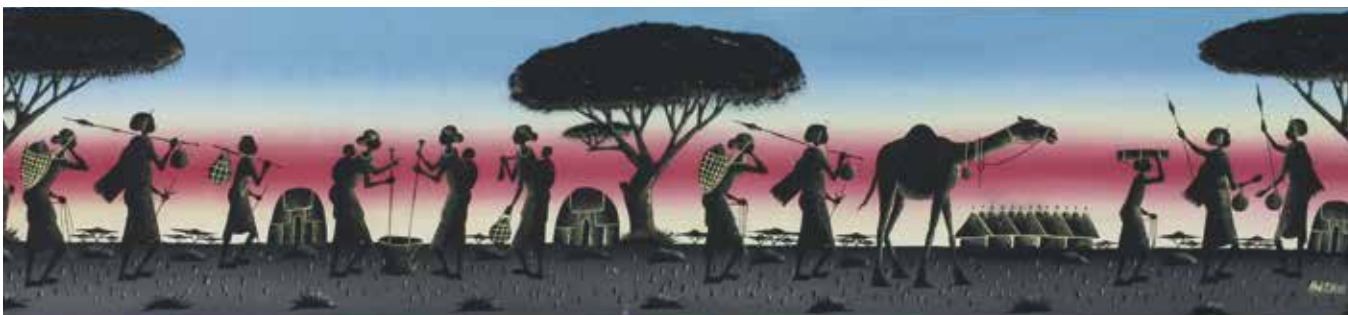
ABAS M. DR. ND., Karavana, 44 cm x 197 cm, olje na lesu, inv. št. GT47