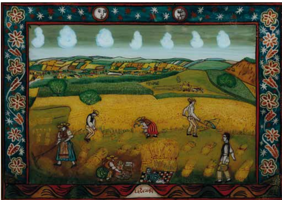
MICHAIL CHERECHES, Žetev, 1988, 38 cm x 53 cm, olje na steklu, inv. št. GT699